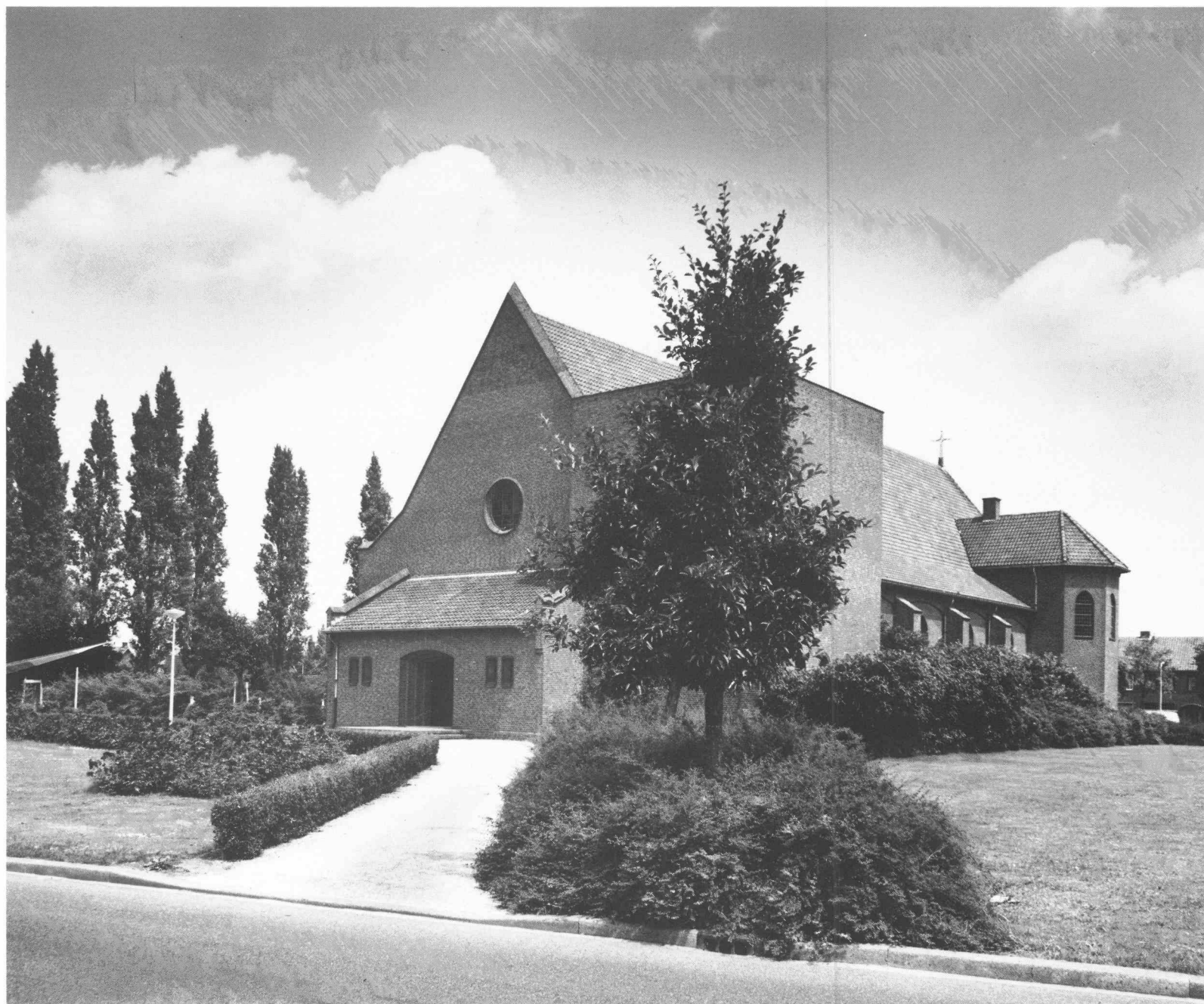
Kerk van de H. Matthias Leuken