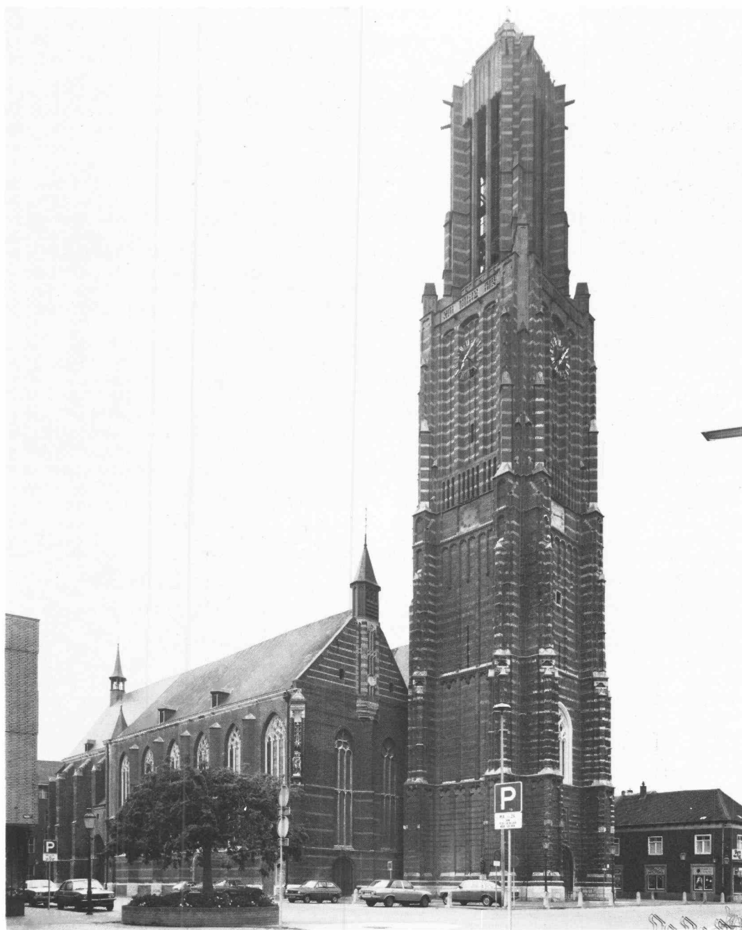
De Sint Martinuskerk