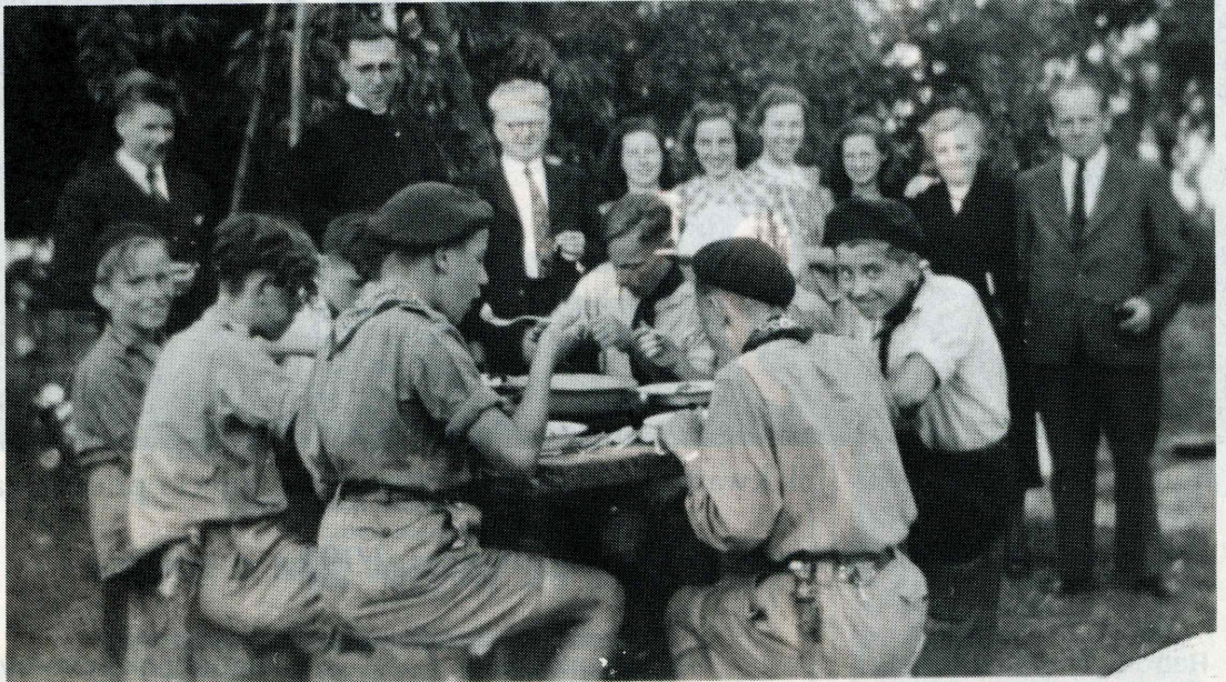
Hoog bezoek tijdens het juniorenkamp te Kessel in 1950.

Elke jaargroep had een aparte (dieren)naam, wellicht afgekeken van de verkenners. Werd men