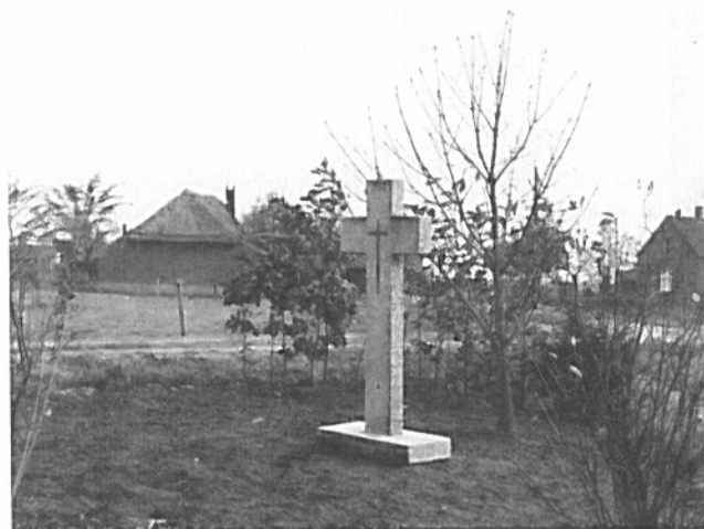
Op "Weevers Tup".