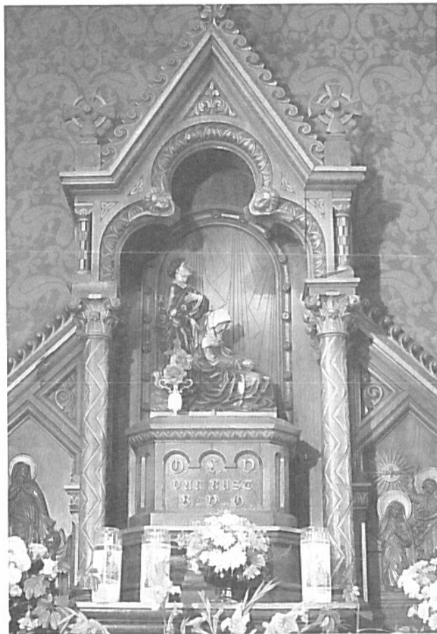
O.L. Vrouw van Rust in de kerk van Heppeneert.

O.L. Vrouw van Rust werd aangeroepen voor de genezing van "schrei- en stuipzieke kinderen, in en buiten de slaap aangedaan, door beroerten en andere kwalen. Evenwel wordt O.L. Vrouw van Rust ook aangeroepen