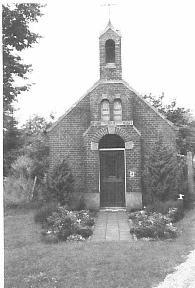
Kapel op de Mildert.

Verscholen achter de spoordijk Weert/Roermond, daar waar deze spoorlijn het kanaal Wessem/Nederweert kruist, ligt het gehucht de Mildert, een vlek van enkele boerderijen, de laatste jaren voor het merendeel verbouwd tot buitenhuizen voor stedelingen. Velen zullen de Mildert nauwelijks weten te vinden, want de moderne verkeerswegen hebben weliswaar veel dorpen en gehuchten uit hun isolement gehaald, met de Mildert was juist het omgekeerde het geval. 69)