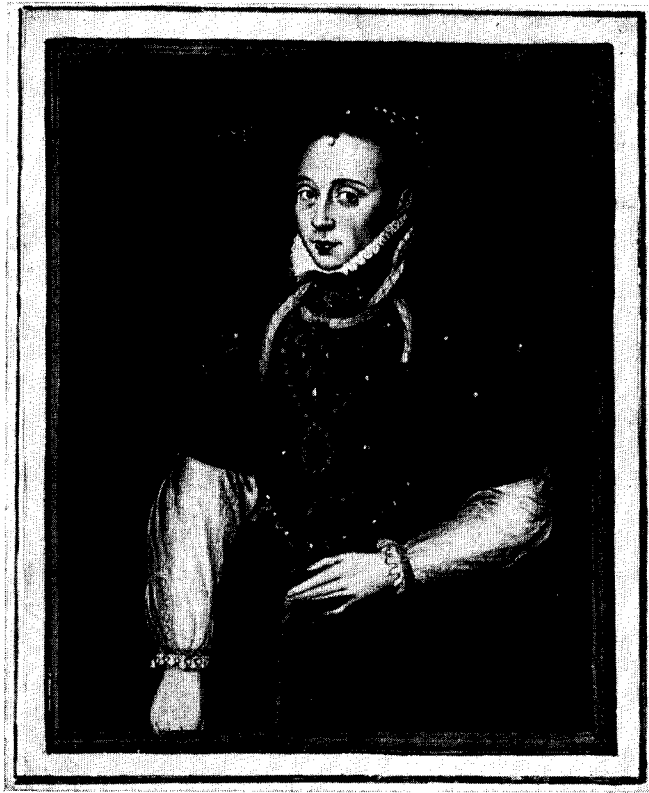
Portret van Walburgis van Nieuenaar, echtgenote van Philips van Montmorency