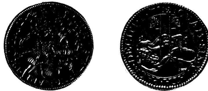
Catalogus nr. 74