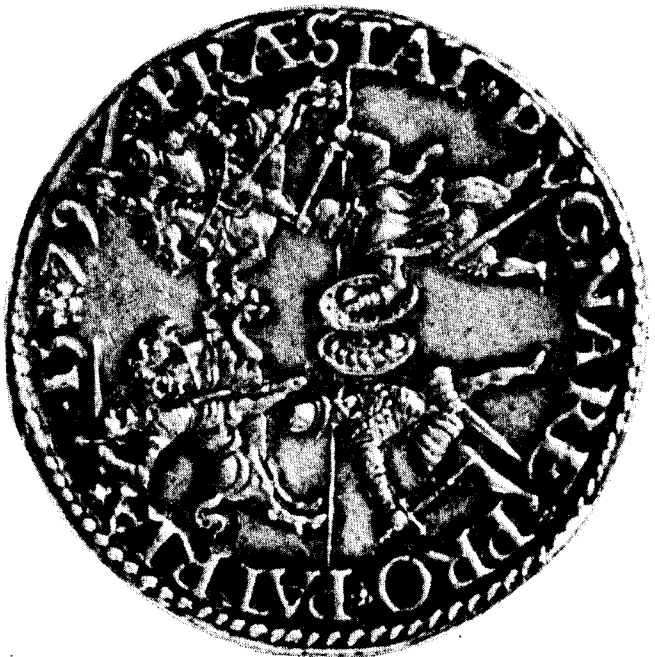
Zilveren Rekenpenning - Dordrecht 1579 - graveur Gerard van Eijlaer Het is beter voor het vaderland te strijden dan door geveinsde vrede misleid te worden Catalogus nr. 74