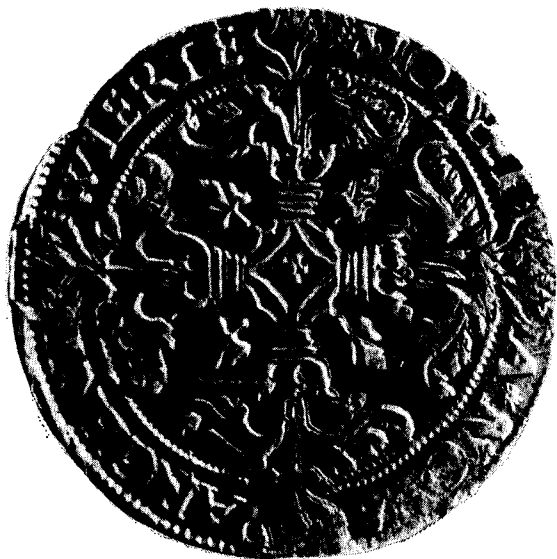
Catalogus nr. 33