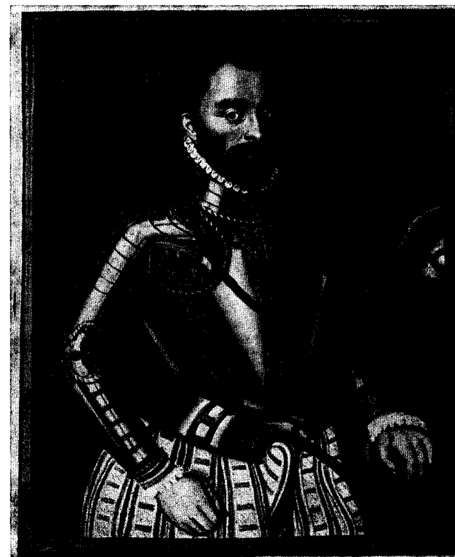
Portret van Philips van Montmorency (Nat. Bibl. Wenen, codex min. 17 fol. 14)