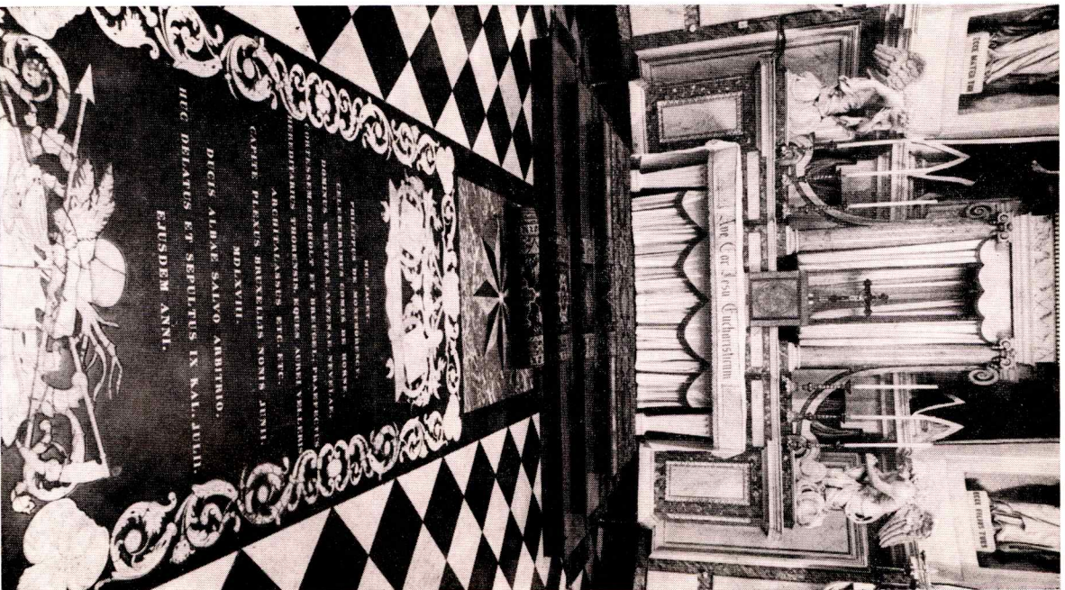
Grafsteen van Philips van Montmorency in de St. Martinuskerk te Weert Catalogus nr. 45