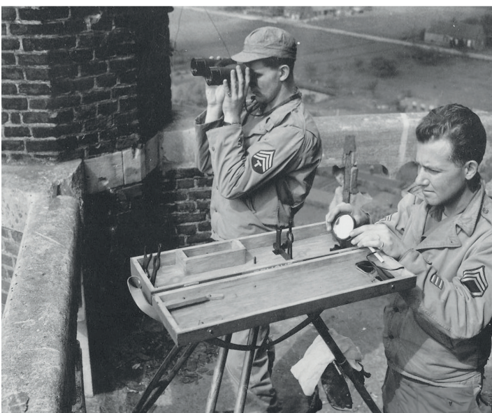
Amerikaanse militairen op de zwaarbeschadigde St. Lambertustoren bekijken de Duitse krijgsverrichtingen aan de overzijde van het kanaal.