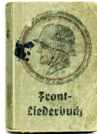
In der haast door een Duitse militair verloren bundel strijdlidderen, gevonden in Strateris bij de binnenkomst van de Engelsen.

De Erfgoedgemeenschap Nederweert is het collectief van vijf organisaties die actief zijn op erfgoedgebied in Nederweert: Stichting Geschiedschrijving Nederweert (SGN), Stichting Regionaal Archeologisch Bodem-Onderzoek (STRABO), Geschied- en Oudheidkundig Genootschap De Aldenborgh, Stichting Cultuurhistorische Publicaties voor de regio Weert en de Stichting Historisch Onderzoek Weerterland (SHOW). Hun doel is het stimuleren van de belangstelling voor, en het behoud van erfgoed in de gemeente Nederweert. Door middel van lezingen, excursies en publicaties. Daarbij wordt ook het zogenaamde immateriële erfgoed niet vergeten, zoals dialect, genealogie, historische tradities en folklore.