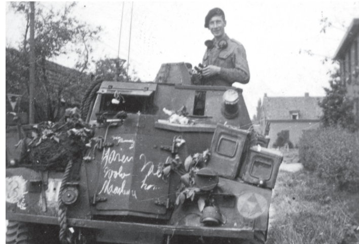
Een met bloemen en krijtopschriften overladen Brits voertuig in Strateris.