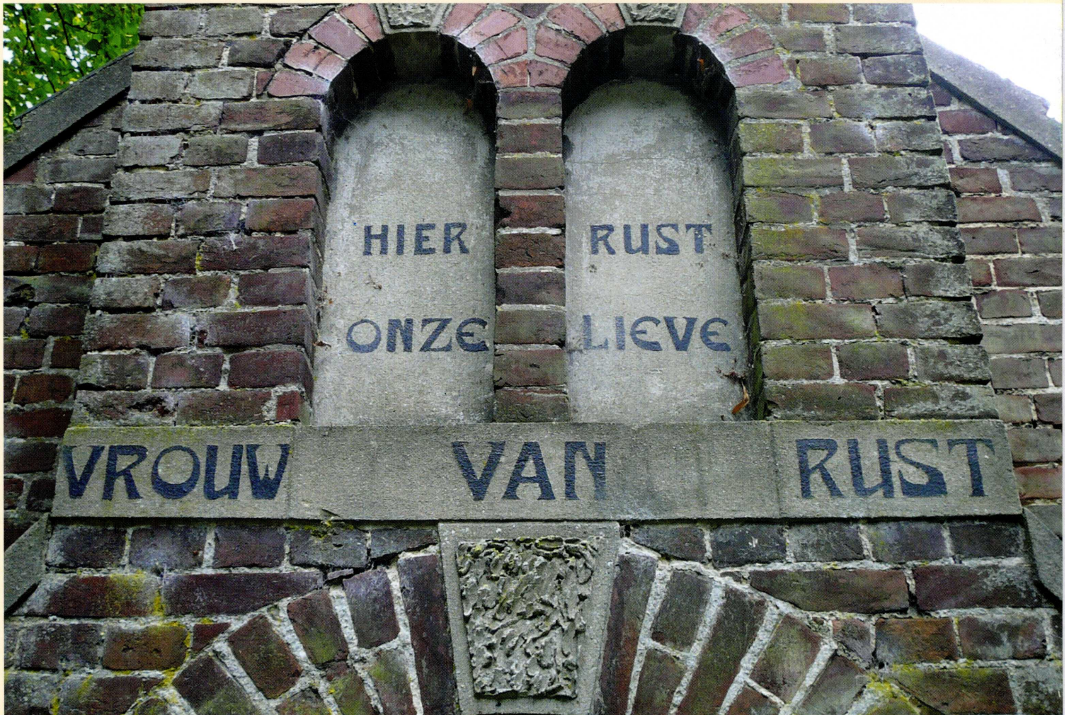
"Hier rust Onze Lieve Vrouw van Rust".