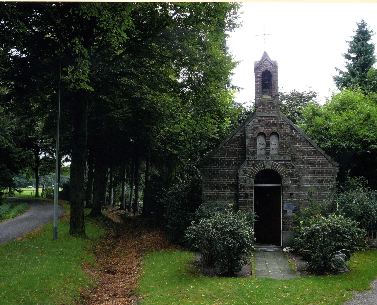
De kapel van Onze Lieve Vrouw van Rust, gelegen op de Mildert.

Ingeklemd tussen snelweg A2, Kanaal Wessem-Nederweert, de spoorlijn Weert-Roermond en de Roermondseweg, ligt in een bosrijke omgeving de Nederweerder buurtschap Mildert. Een handvol boerderijen, buitenhuizen en een pittoreske kapel vormen een oase van rust. Ooit lag hier in de buurt de gemeentelijke executieplaats, waar ter dood veroordeelden werden opgehangen, verbrand of gevierendeeld.